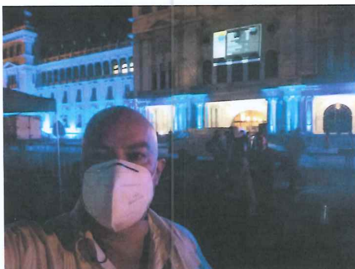
Grabación del Mapping en el Palacio Nacional de la Cultura