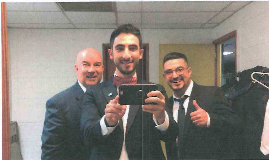
En camerinos del teatro de cámara Hugo Carrillo para grabación del Festival “Septiembre Nuestro”

Se hicieron 2 ensayos en el salón 1 del Centro Cultural, el montaje para grabación el día jueves 9, cableado y pruebas de sonido, luces y tiros de cámara el día 10 desde las 7 am e iniciamos a grabar a las 11 am, terminando alrededor de las 5:30 pm.