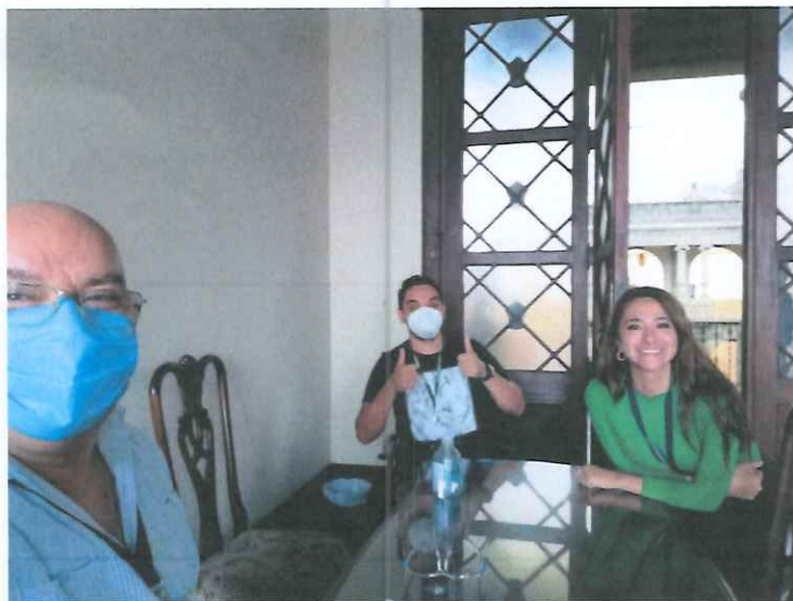
Reunión técnica con personal de la Dirección General de las Artes para gestiones generales.