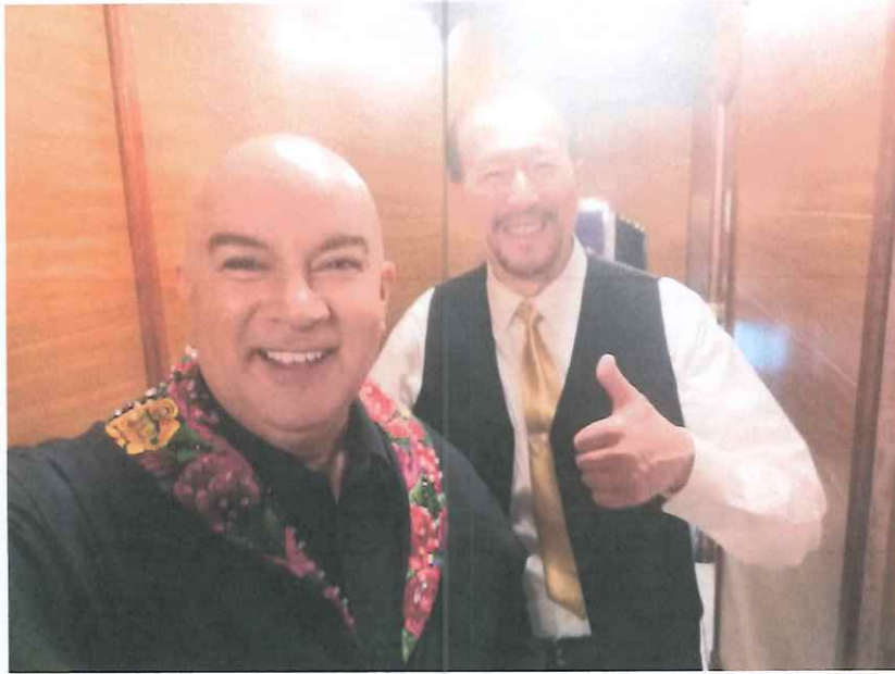
En camerinos del Teatro de Bellas artes junto al Maestro German May