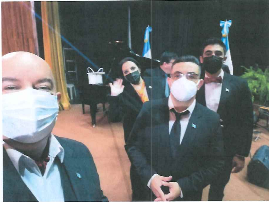
Grabación del Festival "Septiembre Nuestro", Teatro de Cámara "Hugo Carrillo"