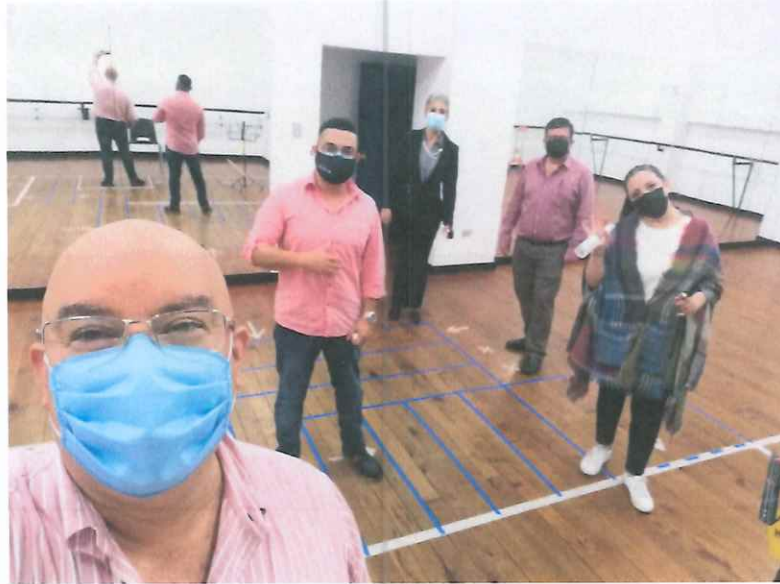
Ensayo previo a la Grabación del Festival “Septiembre Nuestro”,