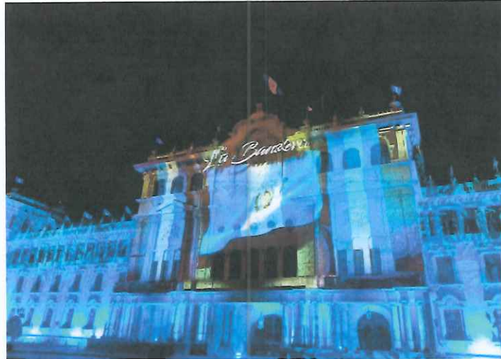
Grabación del Mapping en el Palacio Nacional de la Cultura