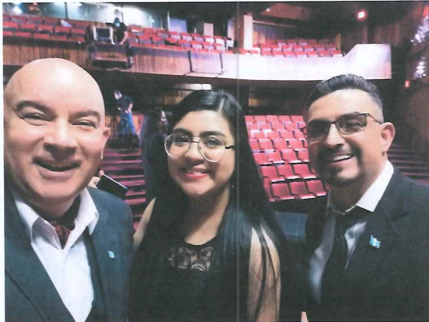
Grabación del Festival "Septiembre Nuestro", Teatro de Cámara "Hugo Carrillo"