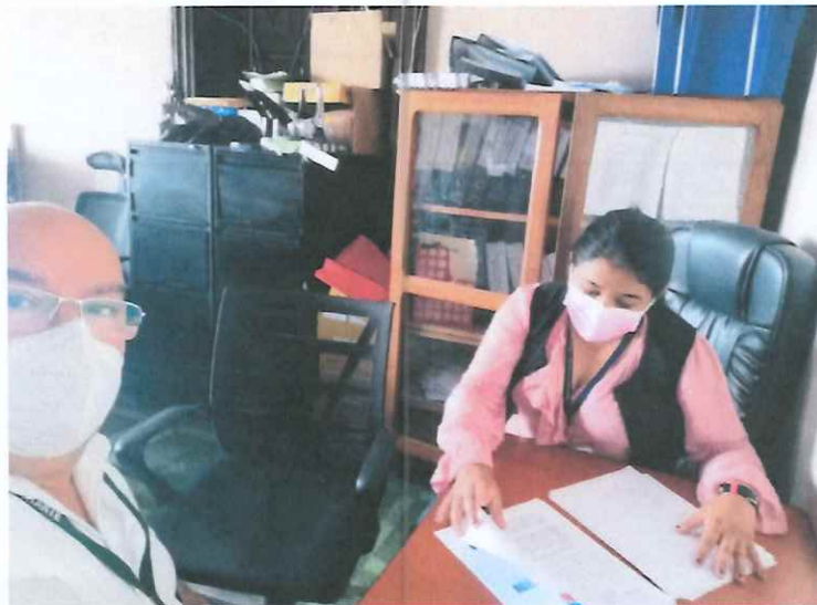
Reunión técnica con personal de CREA

Se les ha dado seguimiento a los proyectos Guatecanta y Haremos de Ti una Estrella, los que van avanzando cada uno a su propio ritmo.