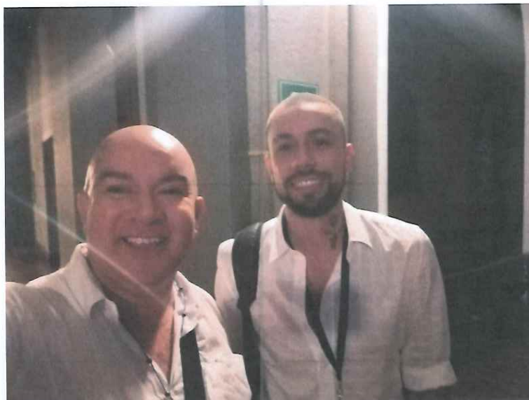
Grabación del Mapping en el Palacio Nacional de la Cultura junto uno de los artistas plásticos