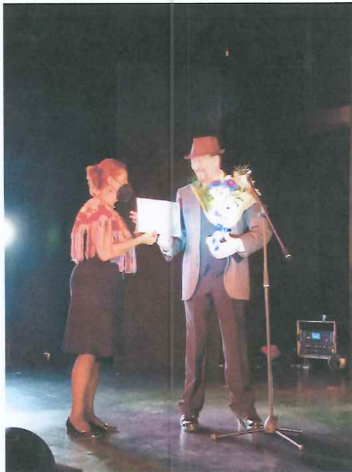
Grabación de La gala de la canción guatemalteca